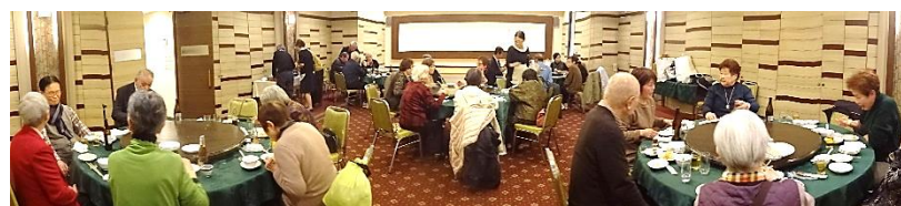
豪華な大宴会場で 新年会の円卓を囲みました