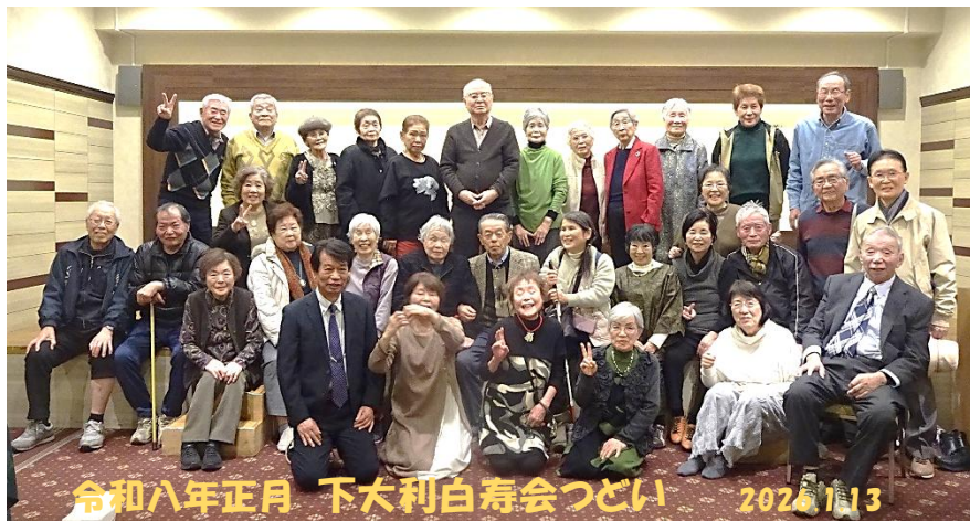
令和八年正月 下大利白寿会つどい 2026.1.13